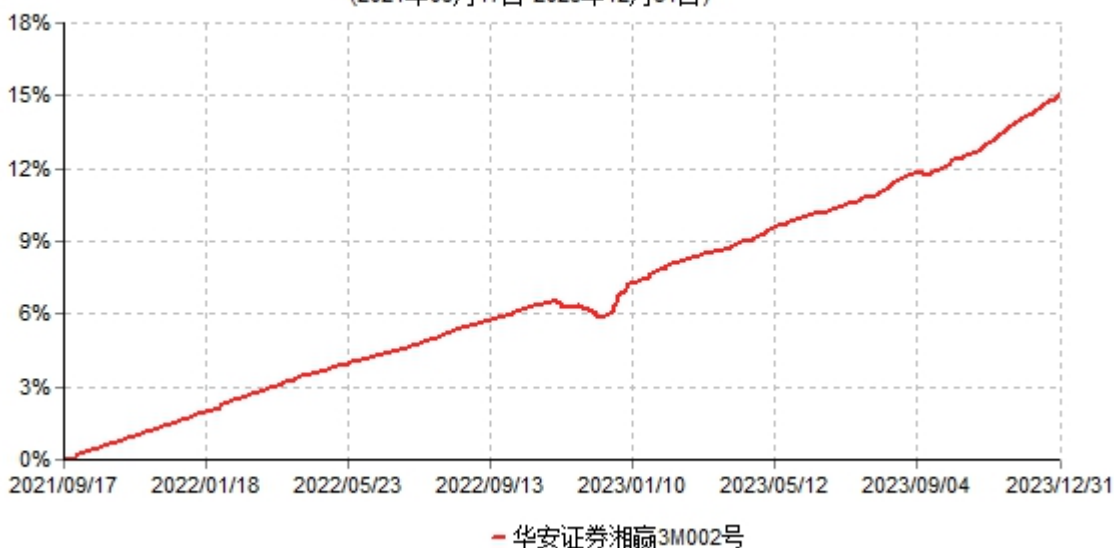
华安证券湘赢3M002号集合资产管理计划累计净值增长率走势图 (2021年09月17日-2023年12月31日)